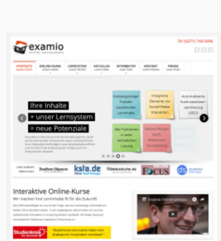
Examio hat sich auf die Online-Vermittlung von Lerninhalten spezialisiert.

Der E-Learning-Anbieter nutzt für das komplette Lernangebot derzeit mehr als 30 Domains mit über 300 Online-Kursen, 3.000 Lernvideos, mehreren tausend Texten und über 10.000 Übungsaufgaben. Die Plattformen werden von über 500.000 Unique Visitors pro Monat besucht. Ein Datenvolumen, das einer leistungsfähigen Hosting-Lösung bedarf, denn Examio hat ambitionierte Wachstumspläne.